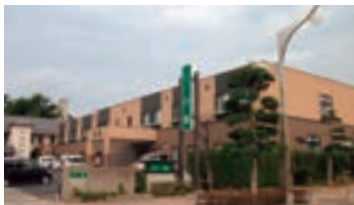
サービス付高齢者向け住宅 白鳳 (鳥取県米子市)