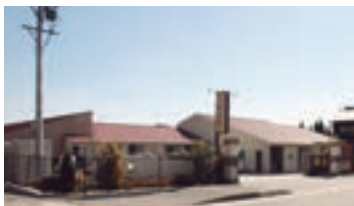
介護付有料老人ホーム わが家松阪 (三重県松阪市)