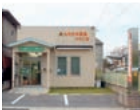
もちの木薬局ひのご店