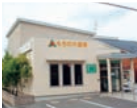
もちの木薬局守山店

当第3四半期は、名古屋市において、「もちの木薬局守山店」および「もちの木薬局ひのご店」の取得による出店を行ない、調剤薬局店舗数は74店舗となりました(平成22年12月1日現在)。