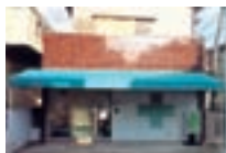
大間野薬局(埼玉県越谷市)