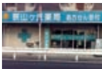
狭山ヶ丘薬局(埼玉県所沢市)